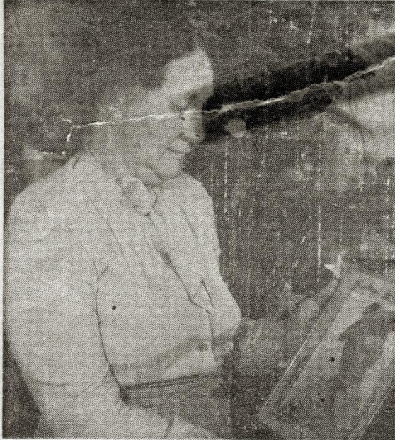
Herald Copyright (Graetz)